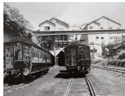
大崎盛《真谷地炭鉱》1987年