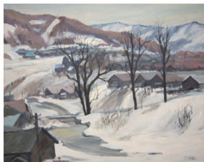
島山哲雄《冬の川》1978年