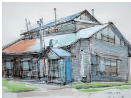
島山哲雄《山手町の2階家》1994年