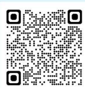
申込フォームQRコード

北海道教育大学へき地・小規模校教育研究センターホームページの「へき地・小規模校教育推進フォーラム」のタブか、右のQRコードから申込をお願いします。