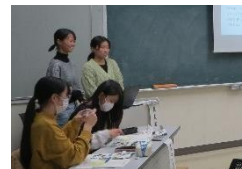
実習Ⅱ・Ⅲ報告会で進行を務める2年生(手前2人)

「自分たちの経験した実習よりもはるかにレベルが高く、教師になるためのスキルアップにつながるがよくわかった。実習Ⅰの経験を踏まえ、実習Ⅱ・Ⅲにも絶対に参加する価値があると確信した！」。