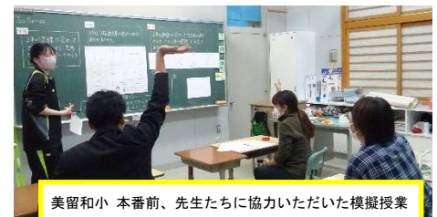
美留和小 本番前、先生たちに協力いただいた模擬授業

すべての学校で複式授業を経験できたわけではないのですが、複数の学年を一度に指導するという事は、最も印象に残る体験の一つです。大学での講義で学生仲間を児童に見立てた模擬授業の経験はあっても「実際の子どもたちを前にすると全く違う」、「やってみなければわからない大変さがある」等、苦戦したという声も多い一方で、「この経験は小規模校以外の学校でも活用できそう」と手ごたえを感じている学生もいました。