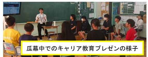
瓜幕中でのキャリア教育プレゼンの様子

今年度は中学校での受け入れが特に増えました。将来は小学校の教員になりたいという学生が比較的多いのですが、原則実習希望者は学校種を選ぶことはできません。しかし中学校で実習を行った学生