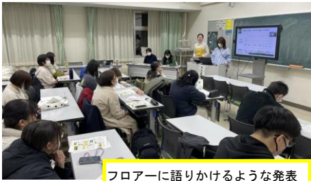
フロアーに語りかけるような発表

実習Ⅰ同様、3・4年生対象の実習Ⅱ・Ⅲも昨年度を大きく上回る33名の学生が実習に臨みました。その多くが、実習Ⅰ（2年時）や実習Ⅱ（3年時）で既にへき地校