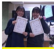
修了証を受け取って