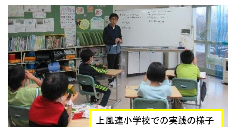
上風連小学校での実践の様子