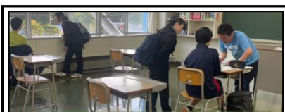
昆布森中発表のスライドより