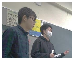
報告会のテーマは「心をこめて」

実習Ⅰで例年も多く聞かれるのは、「(週一度のフィールド実習とは違い)1週間という短い期間だが、毎日子どもたちと続けて向き合うことで、あらためて子ども一人一人としっかり向き合うことの大切さを学んだ」ということです。「子どもとの距離感」についても実習課題としてあげる学生が多く、新たな発見、目標を見出したという声が聞かれました。