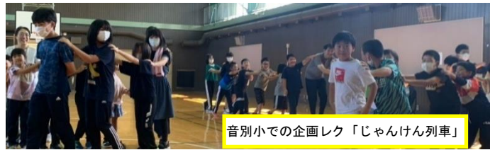
音別小での企画レク「じゃんけん列車」

中学校実習でのプレゼンに対し、多くの小学校では、自分たちで企画したゲーム等の活動を実施させていただけました。苦勞して計画した企画で子どもたちが喜んでくれることに大きな喜びを感じたようで、「主体性」を育てることの大切さを自ら感じることができました。