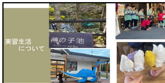
実習Ⅱ・Ⅲ報告会スライドより (上)川湯小学校 (下)下幌呂小学校

Zoomで担当の先生からコメントをいただいている様子。忙しい現場を体験した後ということもあり、勤務時間外にもかかわらず実習後も見守ってくださったことに、学生たちも感激。本当にありがとうございました。