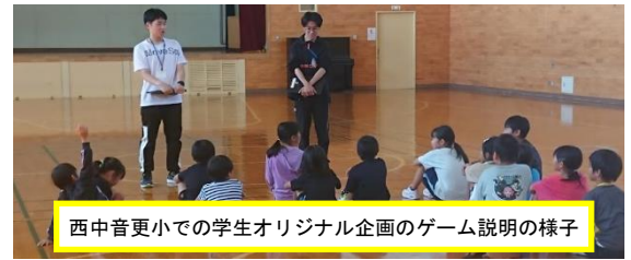
西中音更小での学生オリジナル企画のゲーム説明の様子

主体性を育てることの重要性については、ほとんどの実習生が報告しており、中には実習生自らが授業観察のプログラムを考え、主体的に実習に取り組むよう仕向けていただいた学校もありました。