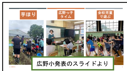
広野小発表のスライドより

新型コロナ感染対策がある程度緩められた関係で、地域や子どもたちと交わる機会も増えたようで、休み時間等でたくさん遊ぶことができたことが何より楽しかったようです。