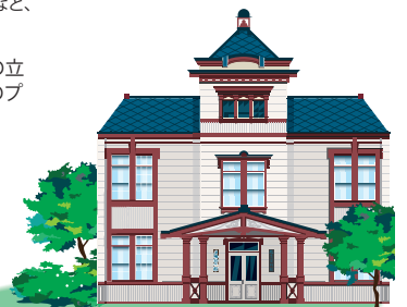
登録有形文化財「夕陽記念館」(北海道教育大学函館校敷地内)