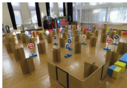
【実践 7: ドキドキ看板迷路】