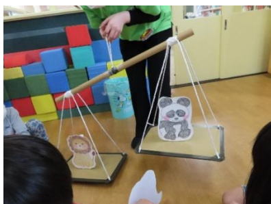
【実践 4: 動物重さ比べ】

標識をテーマに「標識の役割を理解し、進んで遊びに取り入れようとする」ことをねらいとし、迷路の中に12種類の看板を置いてコースを変えながら遊んだ。活動では、自分たちで標識の意味(矢印の方向に進む、動物の真似をする、等)を理解してそれに従って行動し、ゴールするためにどの方向に進むべきかを判断している姿が見られた(数量や図形、標識や文字などへの関心・感覚)。標識が自分の身の回りにもあることを意識して迷路をする様子も見られた(社会生活との関わり)。また、迷路の先にある標識を見てどこに進めばゴールに近づけるのかを考え、見通しを持ちながら全身を楽しく動かしていた(健康な心と体)。