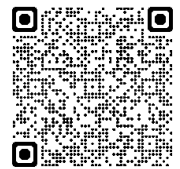
宣伝プロジェクト