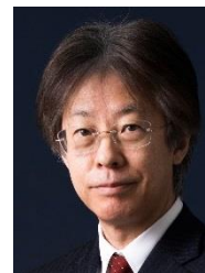
北海道教育大学長