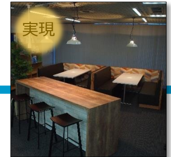
【整備後】 学内予算による整備事例：釧路校キャリアセンター