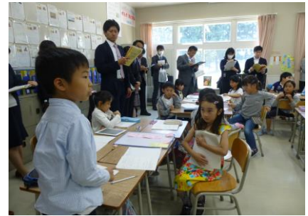
働く「人」について表現する児童の姿

そこで、生活科2年次研究のテーマを『学びのサイクル』を活性化させることで、成長の実感を促す学習づくり」と設定した。「学びのサイクル」を活性化とは、学習過程が行きつ戻りつしながら何度も繰り返すことである。振り返りを充実させることで、「学びのサイクル」は活性化し、自らの成長を実感することができると考えました。