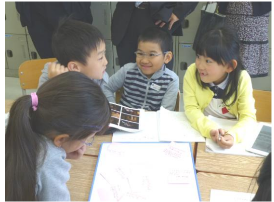
写真1 「すてき」を見直し、語り合う児童の姿

その後の、グループ探検では、「お客さんをきれいに写すために他にも気を付けていることはありますか。」と質問する児童や、もう一度カメラやライトを見直し、自分が確かめたかったことをノートに書く児童の様子からも、一回目のグループ探検の交流により新たな学習問題が生まれ、実際にもう一度写真館に行って確かめようという次の自発的な行動を誘発することにつながっていたことが判断できる。