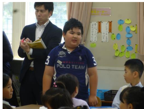
写真2 学びの方のよさを発言する児童の姿