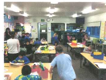
サンドレイク小学校での授業の様子