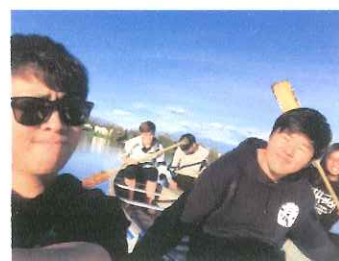
友達が貸してくれたカヌーで湖を散策