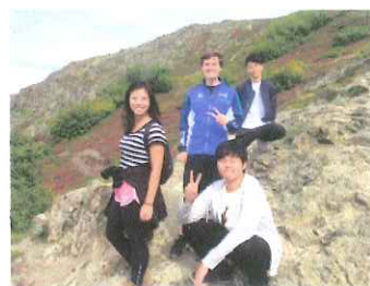
Flat top でハイキング

海外でしか得られない経験を数多くすることが出来ました。支えてくれた家族、友人、先生、大学の事務の方、そして馬場財団様、本当にありがとうございました。