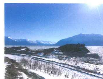
アラスカならではの氷河と大自然