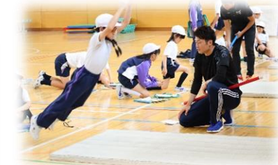
教育大学札幌校 大学が隣接しており、大学生や大学院生が訪れ、実習等を行います。