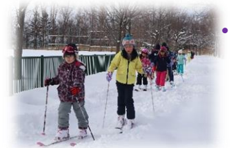
附属山 学校の裏にある附属山ではスキーやそり滑りを楽しむことができます。