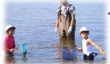
茨戸川 校地の裏にある茨戸川ではエビや魚がたくさん捕れます。生活科の学習では探検に出かけます。

本校児童は、札幌市全域から通学しています。そのためバスなどの公共交通機関を利用して通学している児童が、全校児童の91%に（令和2年度）及びます。地下鉄麻生駅・栄町駅、JRあいの里駅と本校の間には、本校児童用通学バスが運行（増便）されており、多くの児童が登下校に利用しています。